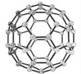
フラーレンの構造